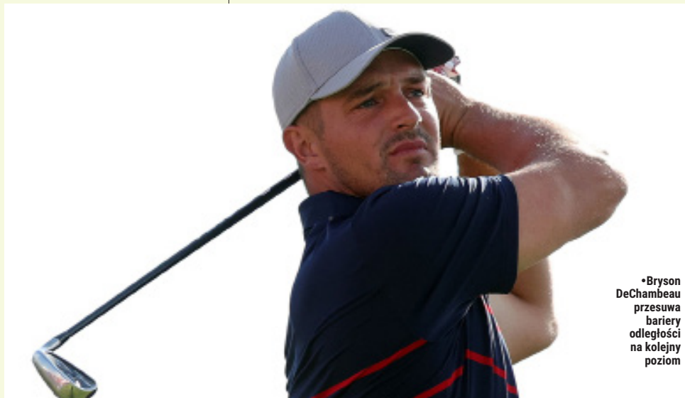
•Bryson DeChambeau przesuwa bariery odległości na kolejny poziom

T.Z.: Z drugiej strony mamy Alejandro Pedryca, który w Klubowych Mistrzostwach Polski Mężczyzn z białych tee rozgrywa trudne Kalinowe Pola na 65 (-7), robiąc 8 birdie i 1 bogeya, czyli gra już tak kosmicznego golfa, że jego hcp -5,2 wydaje się oczywistą